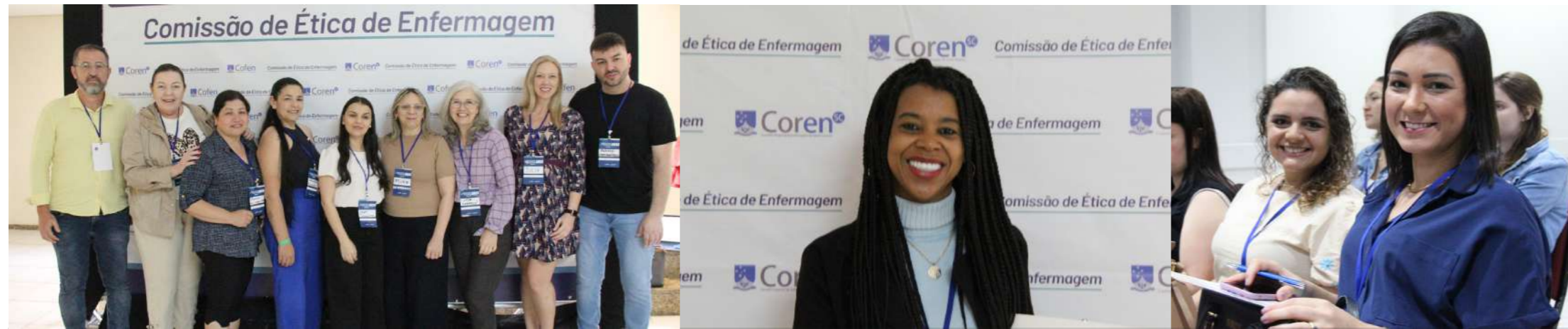
A etapa estadual do Encontro de Comissões de Ética de Enfermagem reuniu cerca de 200 pessoas para o compartilhamento de experiências, realização de atividades e participação de palestras sobre o exercício ético da profissão

"Gostei muito dos estudos de caso que a gente fez, acho que ajudou a ampliar de várias formas. Informação e conhecimento sempre são o caminho"