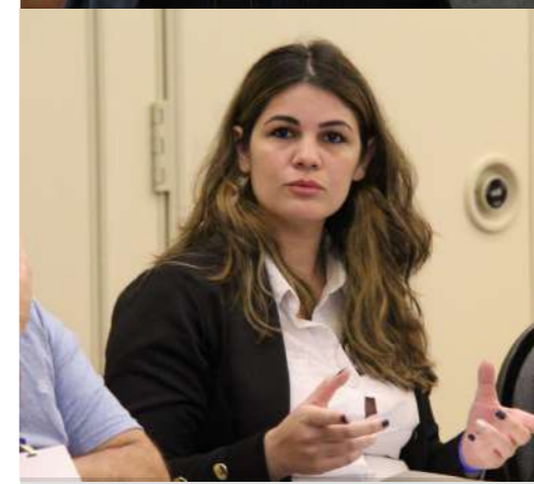
Profissionais participaram de dinâmicas para compartilhar conhecimentos