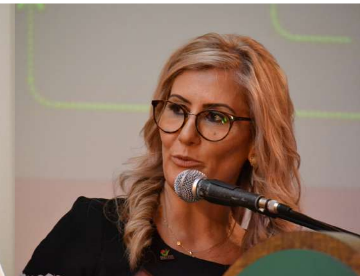
Em 2023, o Coren-SC realizou uma pesquisa via formulário para identificar o perfil dos profissionais empreendedores na Enfermagem catarinense. Cerca de 50% do grupo que respondeu a pesquisa atua há menos de um ano no ramo do empreendedorismo