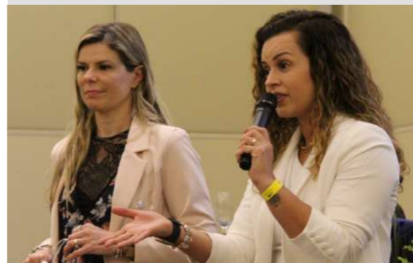
Palestrantes do Coren-SP falam sobre conflitos no ambiente profissional durante o Encontro Estadual de CEEs.