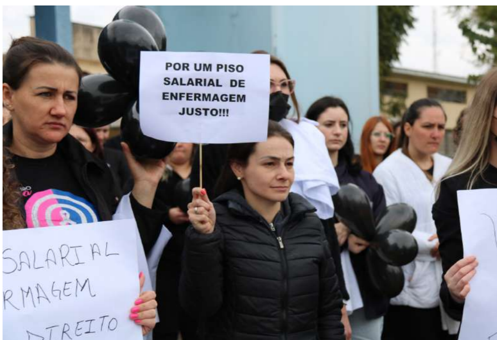
Manifestantes em defesa do Piso Salarial da Enfermagem, em setembro de 2022, em São Miguel do Oeste- SC

A pesquisa ainda levantou o tipo de instituição na qual o RT representa. Das 370 participações, a porcentagem de respostas ficou assim: