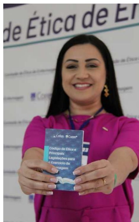
Livreto do Código de Ética e Legislações da Enfermagem, produzido pelo Coren-SC, foi distribuído no evento

Integrantes de Comissões de Ética de Enfermagem de Santa Catarina, nos dias 21 e 22 de setembro de 2023, realizaram um momento de muita troca de experiências e ricos debates. O Encontro Estadual de Comissões de Ética de Enfermagem (CEE), em Florianópolis, reuniu cerca de 200 profissionais de Enfermagem, entre enfermeiros, técnicos e auxiliares.