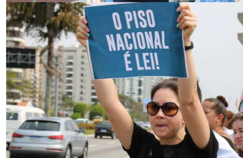
Em Florianópolis, mais de 500 pessoas estiveram em manifestação pelo Piso Salarial da Enfermagem