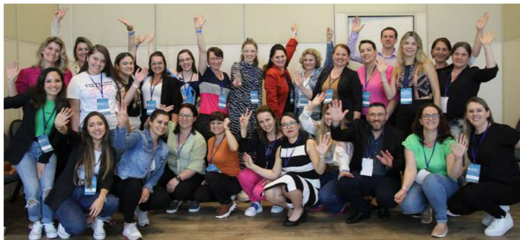
Enfermeiros RTs de Santa Catarina trocaram experiências e falaram sobre desafios da profissão em Encontro

— Nossos prédios estão caindo sobre nossas cabeças, mas a gente segue lutando pela nossa enfermagem. Tivemos recentemente a aprovação da Lei do Descanso Digno para a Enfermagem. Esse encontro de hoje é importante, inclusive, para debater ações para implantar essa Lei.