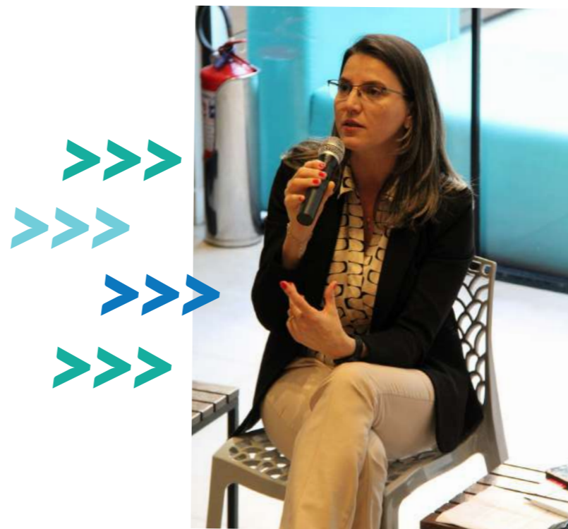
Farinella integra o Grupo de Trabalho sobre Empreendedorismo