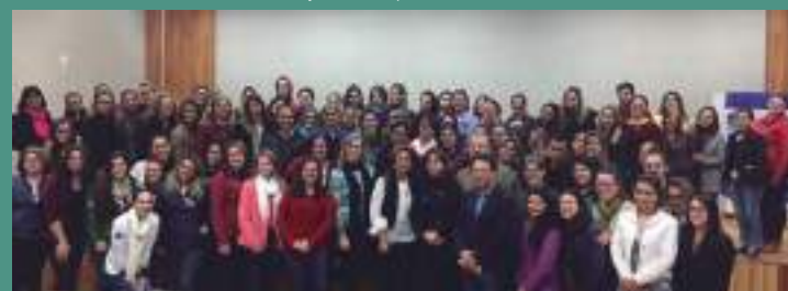
Curso em Lages com apoio da Uniplac (2017)